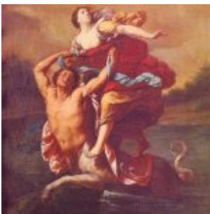
“Rapto de Europa” (Museo Jijón y Caamaño, Universidad Católica, Quito)

Sus restos descansan en la Capilla de Almas de la catedral.