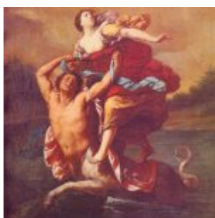
“Rapto de Europa” (Museo Jijón y Caamaño, Universidad Católica, Quito)

Sus restos descansan en la Capilla de Almas de la catedral.