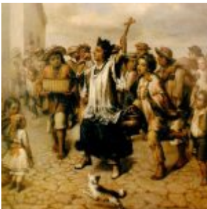
“Sacerdote y Campesinos” (Museo Jijón y Caamaño, Universidad Católica, Quito)