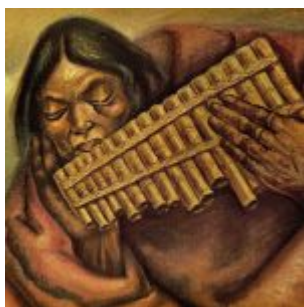
“Hombre con Rondador” (Oleo sobre textil, 62 x 50 cm. (1945) Museo del Banco Central de Guayaquil)