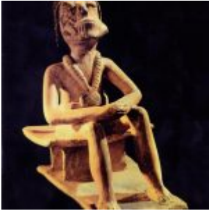
Figura de "Coquero" con pintura facial. (Museo Nacional del Banco Central del Ecuador-Quito)