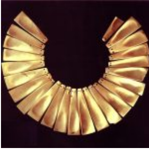
Collar formado por lengüetas de caracol marino. (Museo Nacional del Banco Central del Ecuador-Quito)