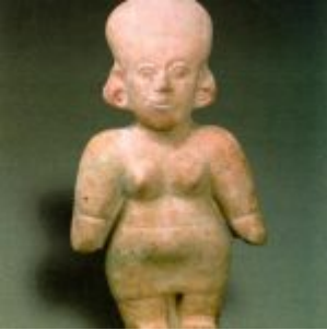
Figura antropomorfa femenina identificada en el período de transición Chorrera-La Tolita. (Museo Nacional del Banco Central del Ecuador-Quito)

Vaso antropomorfo: Canastero de Cusín, identificada en el período de transición Chorrera-La Tolita. (Colección de la familia Eastman)