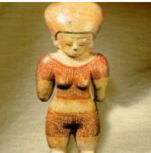
Figura de mujer «Chorrera» creada utilizando la técnica del «vaciado», que se empezó a emplear casi al final de la época pre-Colombina. Al igual que en otras culturas, se destaca la deformación del cráneo acentuada por la forma del tocado o peinado.

Figura antropomorfa femenina identificada en el período de transición Chorrera-La Tolita. (Museo Nacional del Banco Central del Ecuador-Quito)