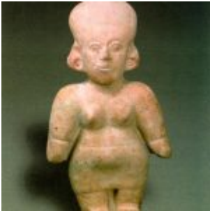
Figura antropomorfa femenina identificada en el período de transición Chorrera-La Tolita. (Museo Nacional del Banco Central del Ecuador-Quito)

Vaso antropomorfo: Canastero de Cusín, identificada en el período de transición Chorrera-La Tolita. (Colección de la familia Eastman)