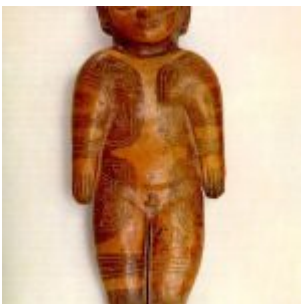
Figura con deformación craneana y decoraciones corporales. (Museo Arqueológico Banco del Pacífico, Guayaquil)

Figura antropomorfa que representa a un artesano con recipiente. (Museo Nahim Isaías (Guayaquil))