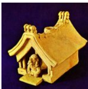
(500 a.C. – 500 d.C.) Figura barro de una casa o templo, con un guardián sentado en su entrada. Museo del Banco Central de