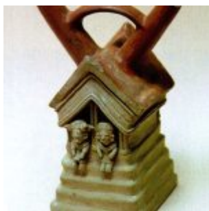
(500 a.C. – 500 d.C.) Botella en forma de vivienda o templo, con dos guardianes en su entrada. Museo Arqueológico Banco del Pacífico

Fue justamente un poblado en el sector de Jama, el primer asentamiento urbano que el piloto Bartolomé Ruiz divisó en 1526, cuando por primera vez llegó a estas regiones.