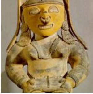
Figura de cerámica que representa una “Novia” sentada. Fue encontrada en el sector de San Isidro, provincia de Manabí.