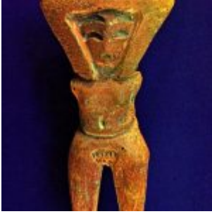
Figura antropomorfa de cerámica que representa a la Diosa de la Fertilidad: también es conocida como “Venus de Valdivia” (Museo del Banco Central de Guayaquil)