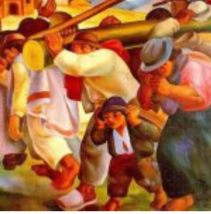
“La Minga” (Oleo de 18 x 20 cm. (1938) / Museo del Banco Central de Quito)