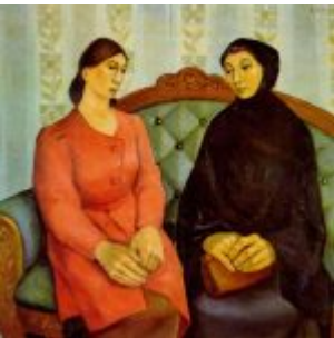
“La Visita” (Oleo sobre lienzo 80 x 75 cm. (1943)