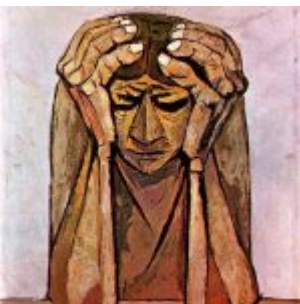
“Mujer Sufrida” (Oleo sobre textil, 69.5 x 79.5 cm. (1961) /