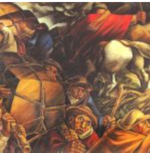
“Los Guandos” (Oleo sobre lienzo 150 x 200 cm. (1941) / Casa de la Cultura de Quito)