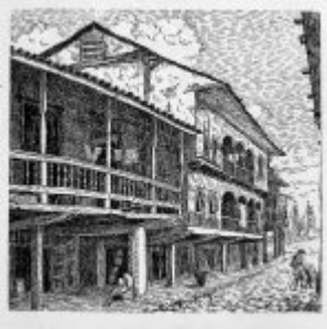
“Calle Villamil” (plumilla)