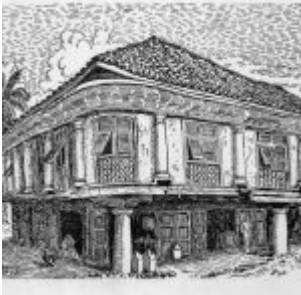
“La Casa de las Columnas” (plumilla)