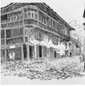
“La Casa de las Cien Ventanas” (plumilla)