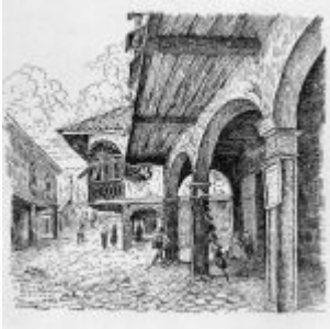
“Portal de las Morán” (plumilla)