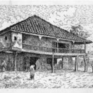
“Esquina de Teniente Vargas” (plumilla)