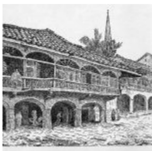
“Calle Villamil” (plumilla)