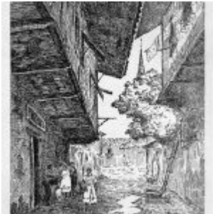
“Rincón de los Suspiros” (plumilla)