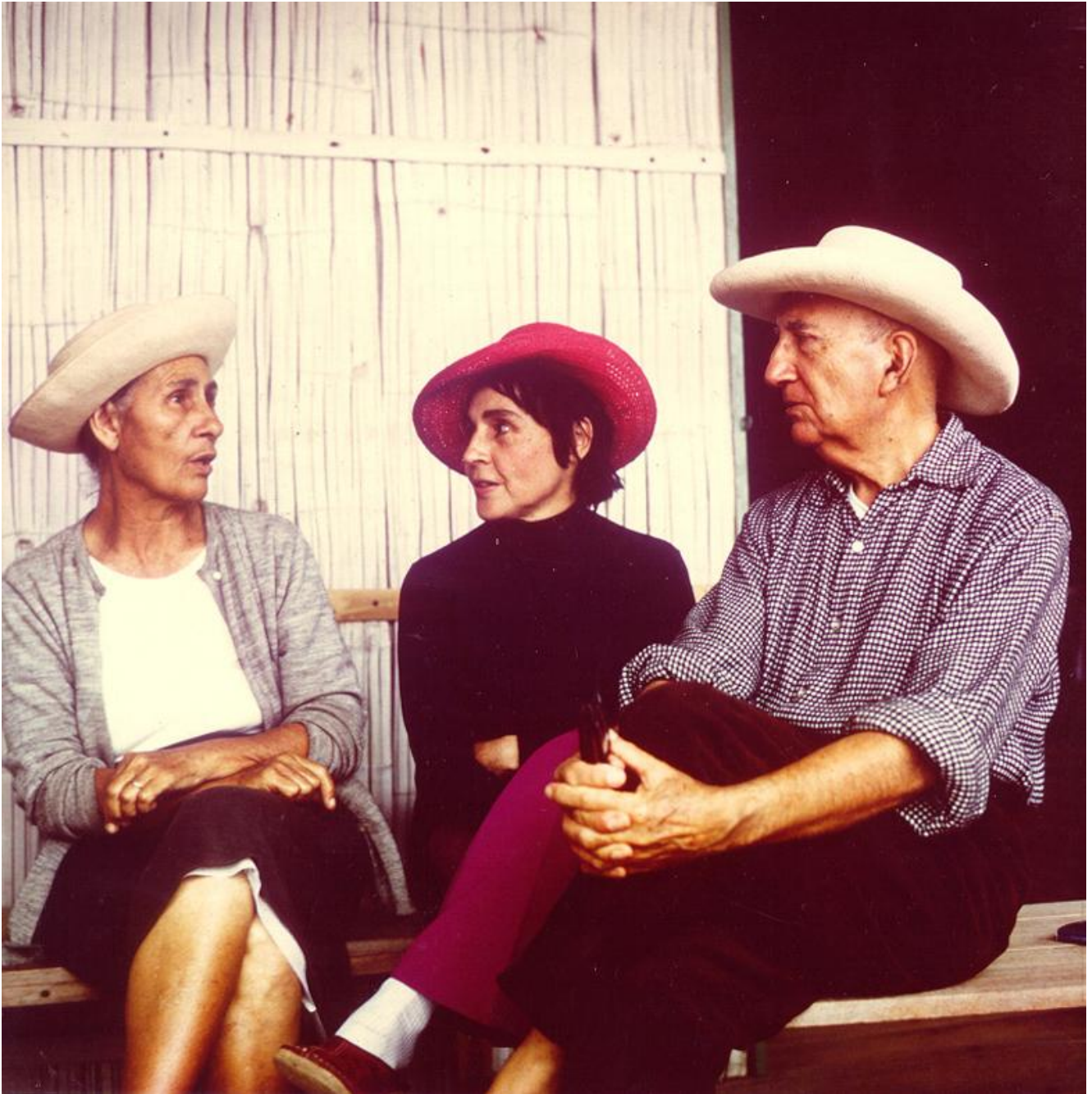
El pintor Manuel Rendón y su esposa Paulette, en la casa que el artista tenía en el pequeño poblado de pescadores de San Pablo, en la península de Santa Elena, lugar que escogió como refugio inspirador durante sus períodos de permanencia en el Ecuador.