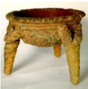
CULTURA MILAGRO-QUEVEDO (500 a.C. – 1533) Cuenco trípode con representaciones de culebras. Museo Arqueológico Banco del Pacífico