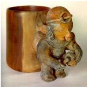
CULTURA JAMA-COAQUE (500 a.C. – 500 d.C.) Vaso con guerrero. Museo Arqueológico Banco del Pacífico