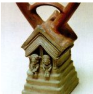
CULTURA JAMA-COAQUE (500 a.C. – 500 d.C.) Botella en forma de vivienda o templo, con dos guardianes en su entrada. Museo Arqueológico Banco del Pacífico