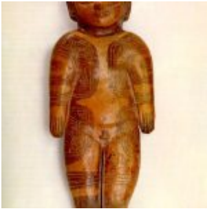
CULTURA GUANGALA (500 a.C. – 500 d.C.) Figura con deformación craneana y decoraciones corporales. Museo Arqueológico Banco del Pacífico