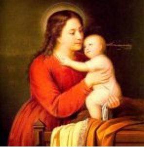
MADONA QUITIÑA Por: Antonio Salguero Siglo XIX Lienzo, 98 x 75 cm. Museo Nahim Isaías (Filanbanco)