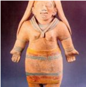
CULTURA JAMA-COAQUE (500 a.C. – 500 d.C.) Figura antropomorfa con pintura post-cocción. Museo Nahim Isaías (Filanbanco)