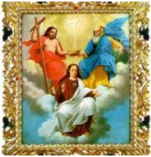
TRINIDAD CORONANDO A MARIA Por: Joaquín Pinto Siglo XIX Lienzo, 94 x 76 cm. Museo Nahim Isaías (Filanbanco)