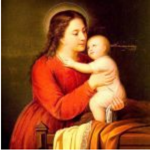
MADONA QUITIÑA Por: Antonio Salguero Siglo XIX Lienzo, 98 x 75 cm. Museo Nahim Isaías (Filanbanco)