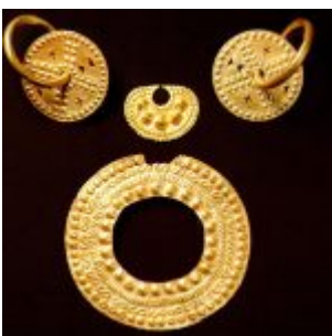
CULTURA MILAGRO-QUEVEDO (500 d.C. – 1533) Juego de ornamentos personales realizado en oro laminado, repujado y calado. Museo Nahim Isaías (Filanbanco)