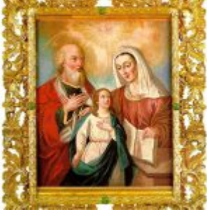
SAN JOAQUIN, SANTA ANA Y NIÑA MARIA Por: Bernardo de Rodríguez Siglo XVIII Lienzo, 72 x 60 cm. Museo Nahim Isaías (Filanbanco)