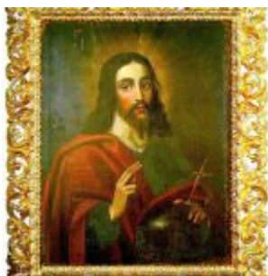
JESUS, EL MAESTRO Por: Nicolás Javier de Goribar Siglo XVIII Lienzo, 92 x 70 cm. Museo Nahim Isaías (Filanbanco)

Posteriormente el museo permaneció cerrado, hasta que finalmente, el 30 de septiembre del 2004 abrió nuevamente sus puertas.