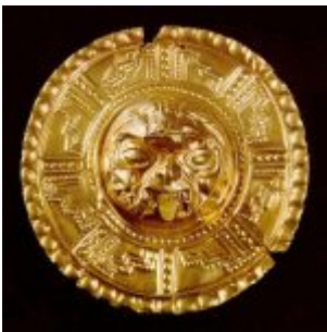
CULTURA LA TOLITA (500 a.C. – 500 d.C.) Pectoral con cara humana, hecho en oro laminado y repujado. Museo Nahim Isaías (Filanbanco)