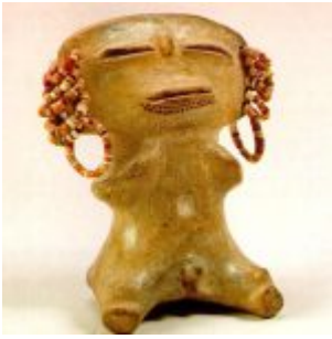
CULTURA MACHALILLA (1.500 a.C. – 1.200 a.C.) Figura antropomorfa sentada, de cerámica. Museo Nahim Isaías (Filanbanco)