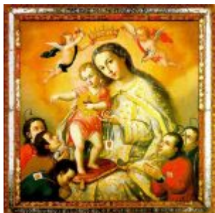
VIRGEN DE LAS MERCEDES CON CAUTIVOS Por: Manuel de Samaniego Siglo XVIII Lienzo, 84 x 84 cm. Museo Nahim Isaías (Filanbanco)