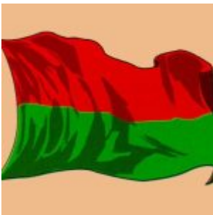
Bandera de la Provincia de Bolivar