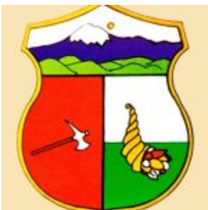
Escudo de la Provincia de Bolivar