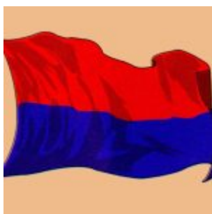
Bandera de la Provincia de Cotopaxi

El 28 de marzo de 1996 toda la provincia fue sacudida por un fuerte movimiento sísmico que tuvo su epicentro en San Juan de Pastocalle.