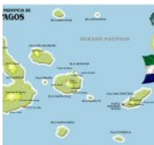
Provincia de Galapagos

Debido a su condición eminentemente volcánica, las islas Galápagos -y especialmente Bartolomé y su bahía de Sullivan- presentan un paisaje fascinante, que ejerce un misterioso atractivo a quienes las visitan. (Foto de 2005)