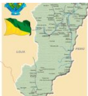
Provincia De Zamora-Chinchipe