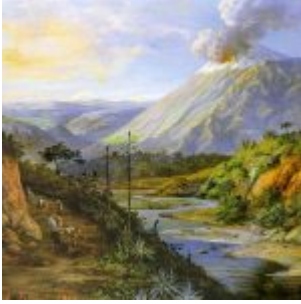
“Tungurahua en Erupción” (Oleo sobre lienzo que se conserva en el Colegio Nacional de Señoritas de Ibarra)