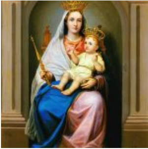
“Virgen de Loreto” (Oleo sobre lienzo (120 x 99 cm- 1908) que se conserva en la Catedral Metropolitana de Ibarra) La temática religiosa copó gran parte de la producción artística de Rafael Troya, quien le dio a su obra un estilo Neoclásico que para esos años era ya imprescindible en el Ecuador.