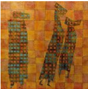
“Pintura Testimonial” (1986) Mixta, 120 x 120 cm. Museo del Banco Central de Guayaquil