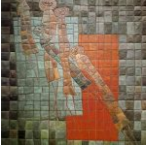
“Serie de Las Ucuyayas” (1987) tierra de colores con cebo, cocinadas a altas temperaturas 8 x 7 m. Col. IBM del Ecuador