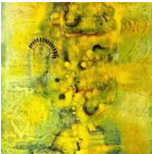
“Abstracto No. 3” (Oleo sobre tela, 0.79 x 0.59 / Banco del Pacífico – Guayaquil)