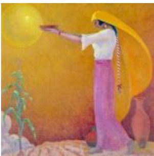
“Inti-Raimi” (Oleo sobre textil, 60 x 60 cm. / Museo del Banco Central – Quito)