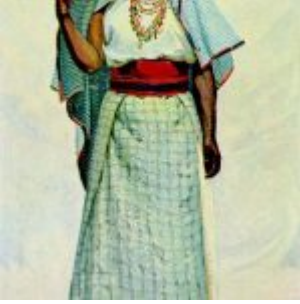
“La India de Zambiza” (Oleo sobre textil, 99.6 x 188 cm. / Museo del Banco Central de Guayaquil)