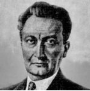
El notable artista Víctor Mideros, cuya inigualable obra pictórica alcanzó fama continental.